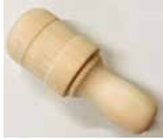
▲富士ヒノキ製がら