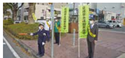
春の全国交通安全運動 初日街頭広報