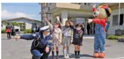
新入学児童入学おめでとう キャンペーン