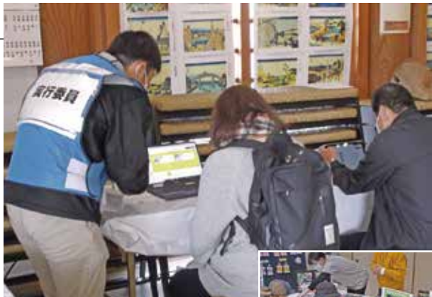
▲12月に開設したポータルサイトを 体験する参加者 体験型ワークショップの様子▶