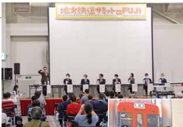
▲鉄道各社などが参加したパネル ディスカッション 車掌になりきって記念撮影 ▶