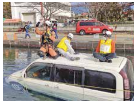
▲緊急消防援助隊全国訓練の様子

災害対応/消防署が保有しているポンプ車は市内に9台、これに対し消防団はおおむね1地区1分団、33台保有しています。特に地元の災害や大規模災害時に活躍します