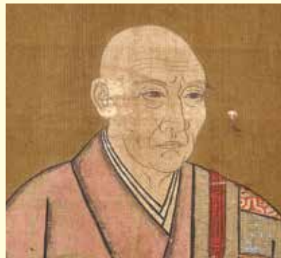
第59回企画展より 太原宗季雪斎像(臨濟寺蔵)