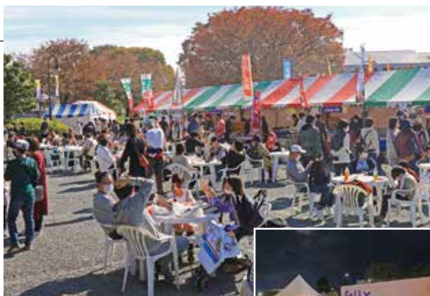
▲様々なグルメをゆっくり堪能 昼間とは変わった雰囲気 でイベントを楽しむ ▶