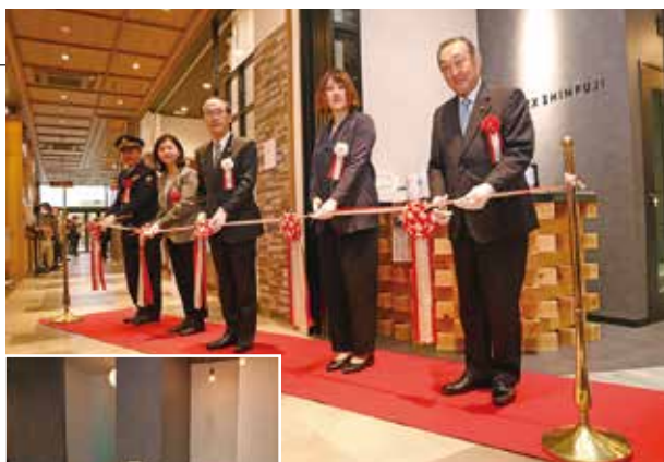
▲テープカットで完成を祝う

セレモニー当日、市長は「多くの交流とビジネスマッチングが生まれることを期待します」とあいさつしました。