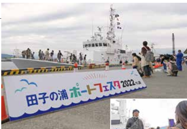
▲船に乗船して中を見学 海上保安庁の制服を着て 記念撮影をする参加者 ▶