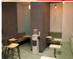
◀フリースペースの様子