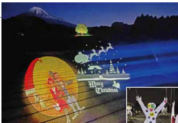
▲富士山を背景に幻想的な景色が広がる 参加者が作った作品。色とりどりの カラーフィルムで飾り付けをした ▶

大淵笹場のライトアップでは、サンタクロースがそりに乗って飛んでいる様子などが茶畑に映し出されました。旧藤田邸の「影のメリーゴーランド」では、ワークショップに参加した子どもたちの等身大のシルエットを切り出し、カラーフィルムで飾り付けたものをライトの周りに設置し、ゆっくりと回転させて光と影が動く様子を来場者たちは楽しみました。