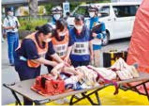
▶救急の口多数傷病者対応訓練の様子

※令和2年度以降の過去問題を市立看護専門学校ウェブサイトで公開しています。詳しくは市立看護専門学校ウェブサイトをご覧ください（解答は全て非公開）。