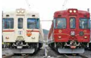
富士山麓電気鉄道(山梨県)