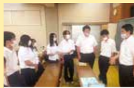
みんなで意見を出し合う