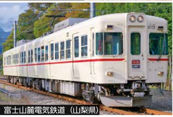
富士山麓電気鉄道 (山梨県)