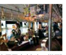
▲夜景電車(車内の様子)