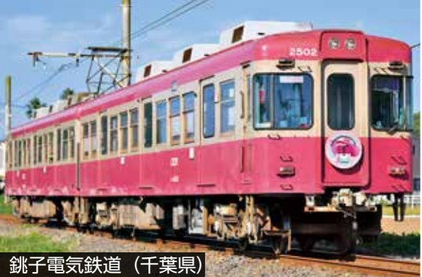
銚子電気鉄道 (千葉県)