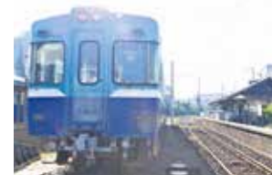
銚子電気鉄道(千葉県)