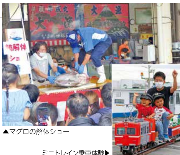
▲マグロの解体ショー