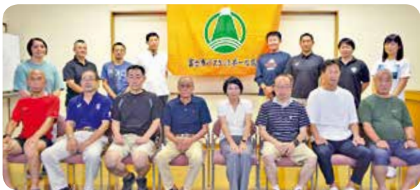
富士市バスケットボール協会