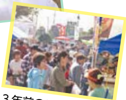
▲3年前のにぎわいの様子