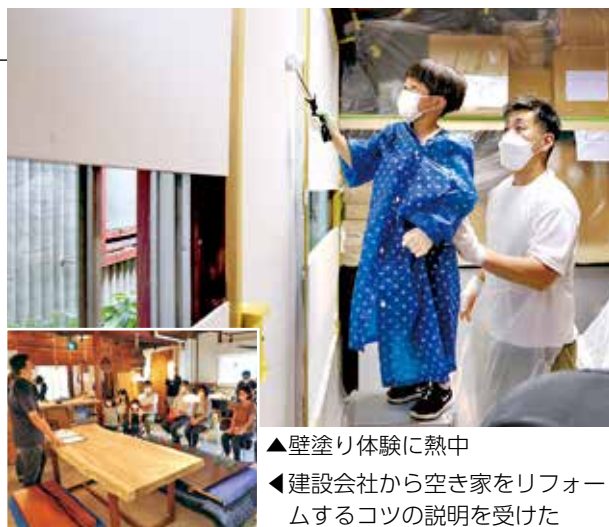
▲壁塗り体験に熱中

参加者は、市役所屋上から市街地を見学した後、築60年の木造平屋で壁塗りを体験。建設会社のリフォーム担当者から、自然由来のペンキの特徴や塗り方のコツ、古さを生かす空間の使い方などの話を聞きました。子どもも参加した40歳代の男性は、「専門家からリフォームのポイントを教えてもらって、空き家活用のイメージが湧きました」と話していました。