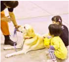
▲災害救助犬とのふれあい