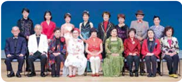
富士マジッククラブ

教育文化スポーツ奨励賞は、教育、文化、スポーツの振興に寄与する市民などの活動を奨励するために贈るものです。今年は1人3団体に贈ります。