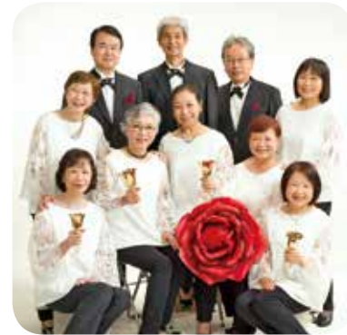
MAUハンドベルリンガーズ