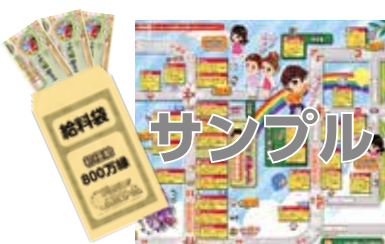
▲給料袋・マップの例

初任給が入った給料袋とゲームマップをもらい、ルーレットを回します。出た数字のお店のマス目にスタンプをもらったら、ゲームスタート!