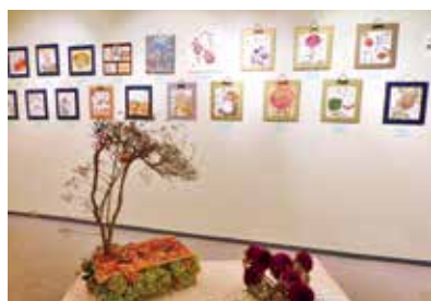
▲過去の展示の様子