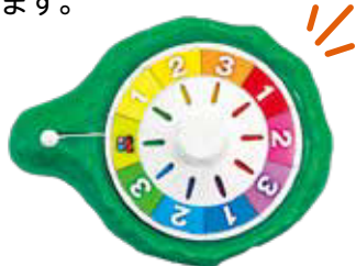
▲各店舗に置かれるルーレット

次のお店を決めるため、ルーレットを回します。店員さんにゲームマップの「次のお店」のマス目にスタンプを押してもらって、次のお店へ進みます。これを繰り返してゴールを目指します。