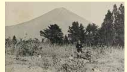
大正四年十一月富士山麓ノ狩猟