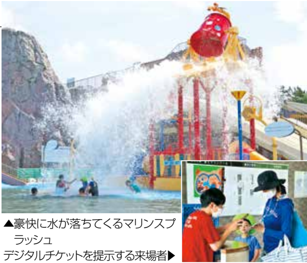
▲豪快に水が落ちてくるマリンスプラッシュ デジタルチケットを提示する来場者▶