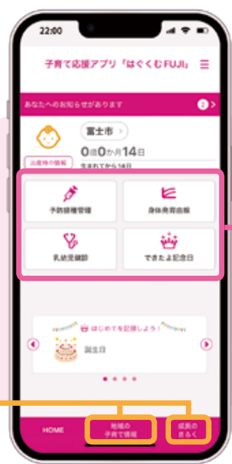
※ホーム画面のイメージ。