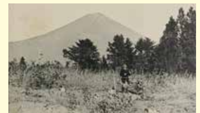
大正四年十一月富士山麓ノ狩猟