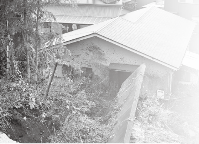
平成19年台風4号の被害（神谷 土砂崩れ）

避難情報は、危険区域に住んでいる人などに避難行動を促すため、防災気象情報や土砂崩れなどの前兆現象があった場合に市が発令します。