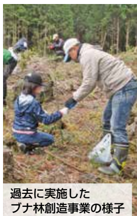
過去に実施したブナ林創造事業の様子

・「生物多様性ふじ戦略」の重点プロジェクトに位置づけた外来種の防除や、いきもの調査などを展開