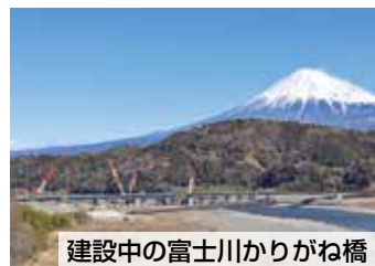
建設中の富士川かりがね橋