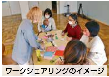
ワークシェアリングのイメージ