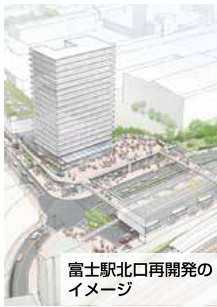
富士駅北口再開発のイメージ