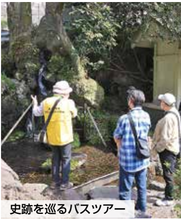
史跡を巡るバスツアー