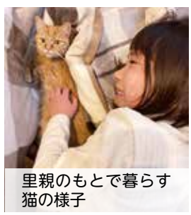
里親のもとで暮らす猫の様子

るときは寂しいですが、譲渡した後も元気に過ごす猫の様子を報告してくれる里親や、活動に必要な物資を寄附してくれる人など、応援してくれる多くの皆さんに支えられて活動を続けています。