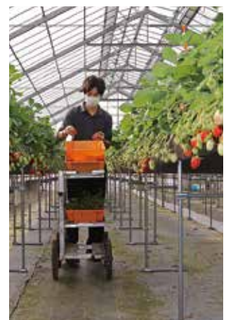
▲高設ベンチでの栽培