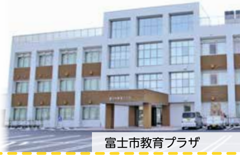
富士市教育プラザ

市民の皆さんの学びを深めたり、新しい趣味を見つけたりする場として、様々な講座を開催しています。気になる講座に参加してみませんか？