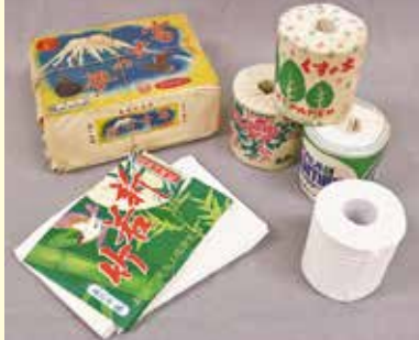
第58回企画展より ちり紙とトイレトーパー