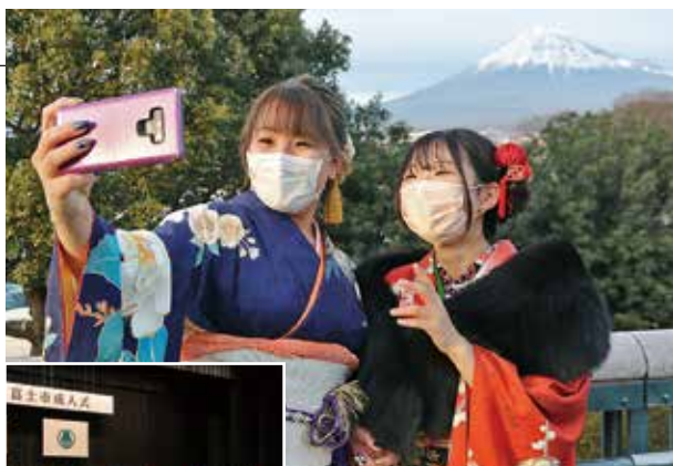
▲富士山をバックに記念写真