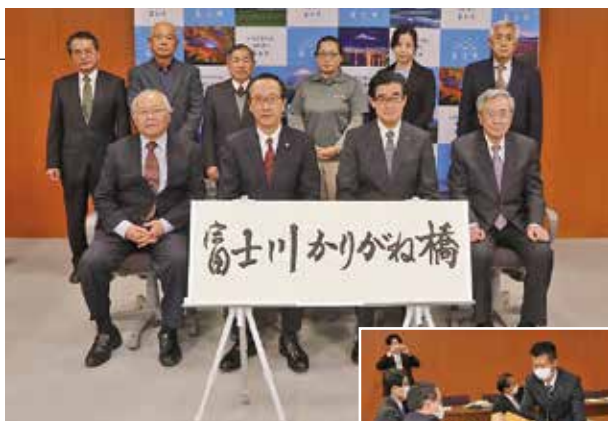
▲名称検討委員会委員