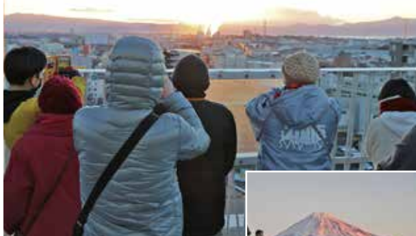
▲初日の出とともに新しい年がスタート