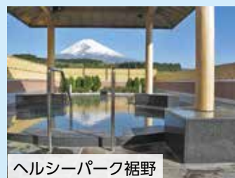
ヘルシーパーク裾野

裾野市のサイクリングコースでのお勧めは、市の運動公園から北に延びるパノラマロードです。目の前に広がる富士山に、春は菜の花や桜、秋はコスモスと季節を感じながらサイクリングできます。パノラマロード沿いにある日帰りの温泉施設、ヘルシーパーク裾野は、県内温泉施設の中でも有数の泉質で、足湯で一休みしたり、サイクリングの後にゆっくり汗を流したりすることができます。ヘルシーパークから北上すると、東京2020オリンピック自転車競技ロードレース（男子）のコースとなった富士裾野ビクトリーロードがあります。途中に開催記念スポットの記念碑があり、サイクルラックとベンチを利用して一休みできます。ここから見える富士山もまた格別です。裾野市では、これらの絶景スポットを含めたサイクリングコースを公開しています。詳細は市公式ウェブサイトをご覧ください。