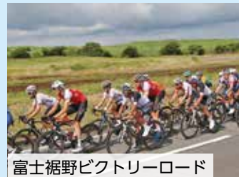
富士裾野ビクトリーロード