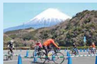
プロ選手が教える自転車教室

このほかにも地理的表示 (GI) 保護制度に登録された「田子の浦しらす」など、富士市でしか味わえないグルメもたくさんあります。ぜひお立ち寄りください！