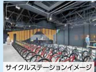
サイクルステーションイメージ