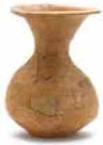
秋のテーマ展より 「富士市宮添遺跡出土弥生土器」