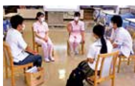
▲令和3年度ぶちキャン2(学校見学会)の様子