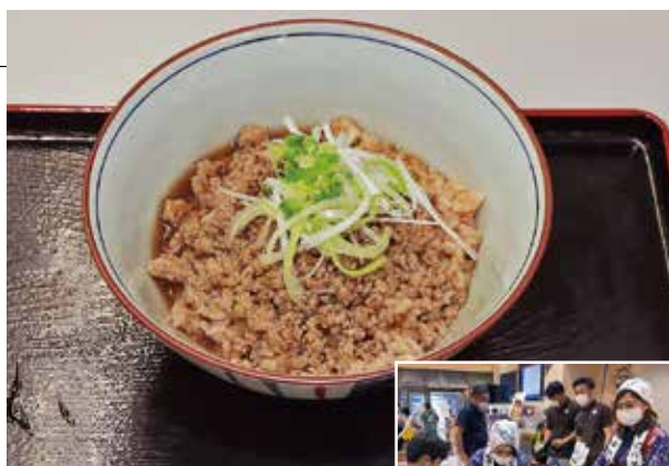
▲ご飯とあんにはほうじ茶を使用したあんかけ丼