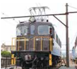
現役当時の様子を再現