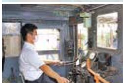
イベントでは運転席に座ることができます