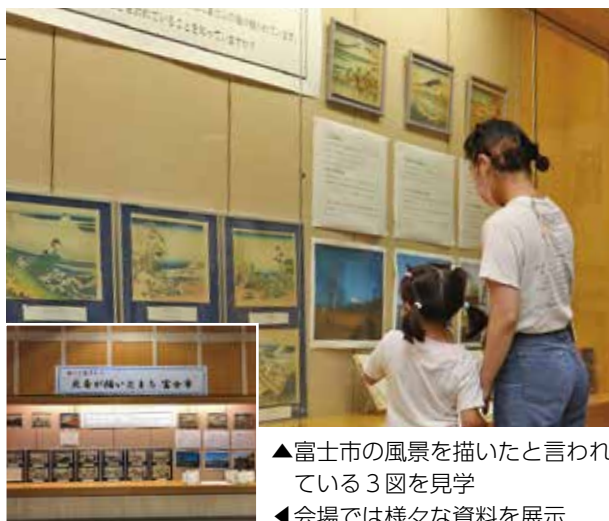
▲富士市の風景を描いたと言われている3図を見学

富士市産ほうじ茶の魅力をPRするため、道の駅内のレストランやフードコートなどで、富士のほうじ茶を使用したパスタや丼もの、スイーツが提供されました。14・15日には道の駅富士川楽座で富士のほうじ茶のトップブランド「凛茶」の販売が始まり、試飲・販売会が行われました。販売された凛茶は水出し専用のティーバッグで、香り高くすっきりした味わいが特徴。11月にはリーフ茶での販売も予定されており、現在商品開発が進められています。