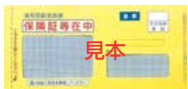
▲保険証が封入される封筒

「紫色」の古い保険証は有効期限（7月31日）を過ぎた保険証は使用できません。細かく裁断するなど、個人情報の取扱いに注意し、処分してください。