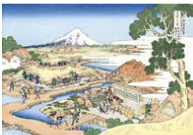
▲駿州片倉茶園ノ不二

「富士市に残る北齋の足跡を辿る会」は、葛飾北齋が描いた「富嶽三十六景」の一つ「駿州片倉茶園ノ不二」が、法蔵寺（中野）から見た景