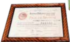
▲受賞したお茶と賞状