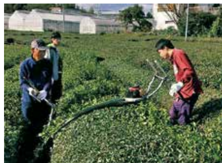
茶畑での作業を手伝う大学生(令和元年10月撮影)

パリの日本茶コンクールで 銅賞を受賞した きのうち 木内茶農園 と 静岡大学お茶サークル「一煎」