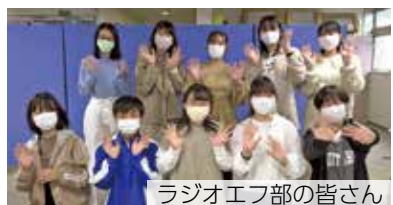
ラジオエフ部の皆さん

富士・富士宮市に在住、在学の中学生と高校生が、自分たちでラジオ番組を制作して放送する学校外の部活動です。現在、12人で活動をしています。