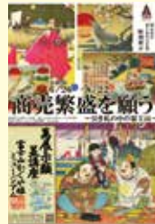
富士山の玉手箱 特別展示

📞 7月10日(土)の9:00から受け付けます。電話で富士山かぐや姫ミュージアムへ 休館日/7月1・2・5・12・19・26日 (原則月曜日)