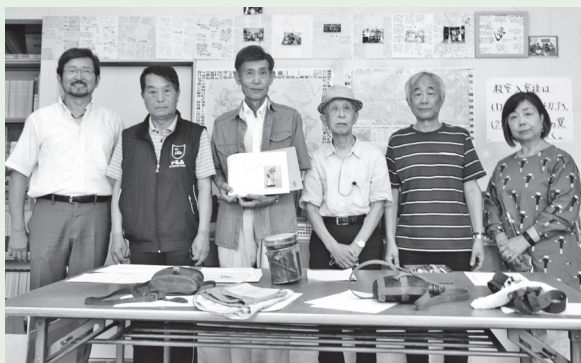
▲「核兵器廃絶平和富士市民の会」の皆さん

毎年8月に、戦争の恐ろしさや平和の尊さを伝える「平和のための富士戦争展」を開催してきましたが、今年は新型コロナウイルス感染症の拡大防止のため中止しました。