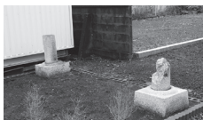
▲根元だけ残る鳥居跡

戦時中は富士市にも空襲があり、犠牲者が出ました。昭和20年には長沢から中桁にかけて数発の爆弾が投下されました。その空襲に