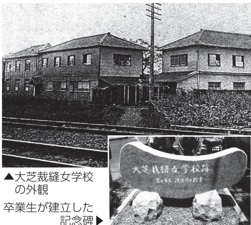
▲大芝裁縫女学校の 外観 卒業生が建立した 記念碑▶

市内には、大芝裁縫女学校校跡の記念碑（水戸島元町）や、爆撃のため根元だけが残った鳥居跡（伝法）、愛宕山の平和祈念碑と地下壕（岩淵）、開拓