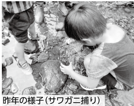
昨年の様子(サワガニ捕り)