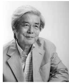
東京大学名誉教授 養老 孟司

第1回 9月17日(木) 19時〜20時30分 (入学式 18時55分〜) 今こそ「生きる」を解剖する