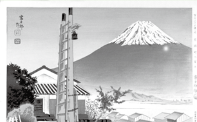
富士山の玉手箱特別展示より「岩淵町の富士」