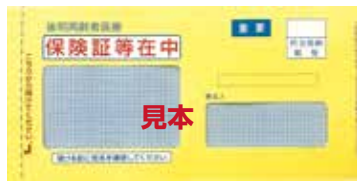
▲保険証が封入される封筒

8月1日から使 用できる藤色の保 険証は「黄色の封 筒」で7月中に郵 送します。