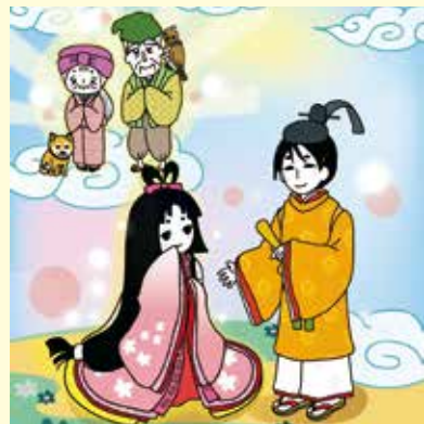
夏のテーマ展から「富士山のかぐや姫」