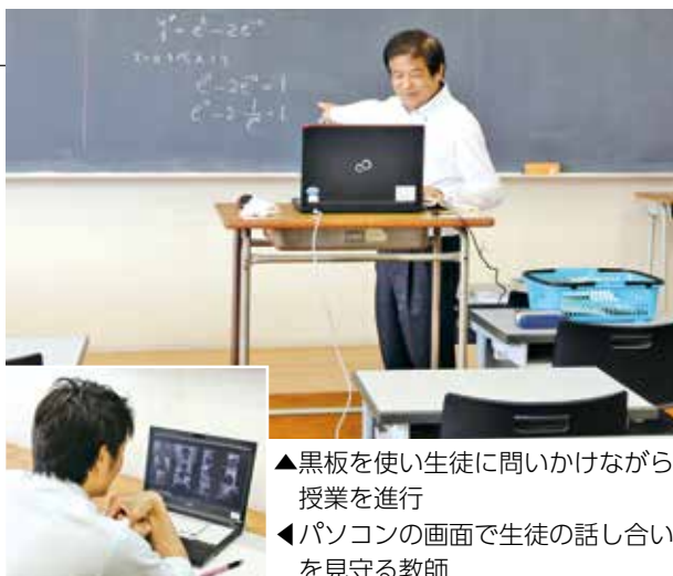
▲黒板を使い生徒に問いかけながら授業を進行 ▲パソコンの画面で生徒の話し合いを見守る教師