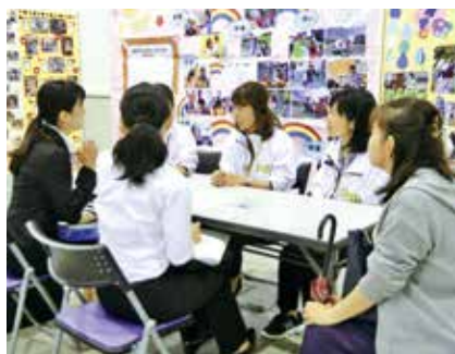
▲多数の参加者が訪れた昨年の就職・進学応援フェア