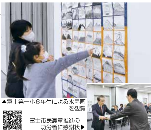
▲富士第一小6年生による水墨画を観賞

同時開催の市民憲章推進のつどいでは、市民憲章の唱和や市体育協会の活動紹介を行いました。また、平成16年から市民憲章を広く普及するため活動が続けてきた富士市民憲章推進会の解散が決まり、功労者に感謝状を贈呈しました。