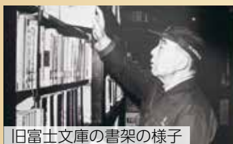
旧富士文庫の書架の様子