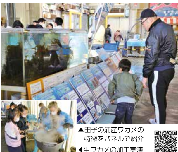
▲田子の浦産ワカメの特徴をパネルで紹介 ◀生ワカメの加工実演