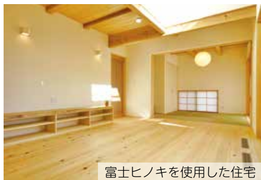
富士ヒノキを使用した住宅

申し込み／上棟予定日の1か月前までに、必要書類(市ウェブサイトからダウンロード可)を直接または郵送で、富士地域材利用推進協議会へ【市ウェブサイト】からしと市政くらし。手続↓住まい↓住まいの補助金↓富士地域材使用住宅取得費補助金(富士ヒノキの家)