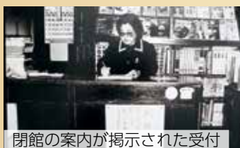
閉館の案内が掲示された受付