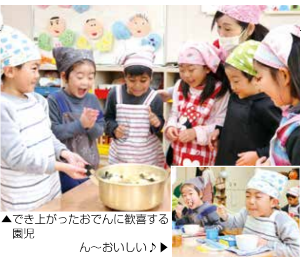
▲でき上がったおでんに歓喜する園児