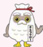
シルバーイメージキャラクター「チエブクロー」