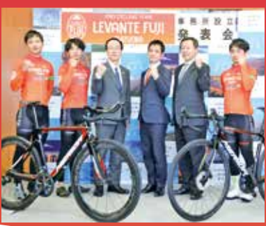
▲2月5日(水)に行われた発表会で決意表明する選手と関係者

今後は、選手たちによる自転車教室や、施設を訪問して行う体操教室などを実施するほか、サイクルツーリズムの推進に向け、本市と連携した活動を行っていただきます。