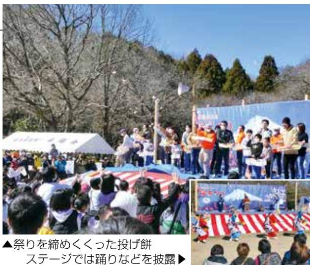
▲祭りを締めくくった投げ餅 ステージでは踊りなどを披露▶

https://www.youtube.com/user/ShizuokaFujiCity