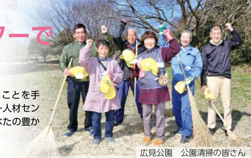
広見公園 公園清掃の皆さん

シニア世代が働くことを通じて生きがいを得ることを手助けし、地域社会の活性化に貢献する、シルバー人材センター。自分のために、そして社会のために、あなたの豊かな知識と経験を生かしてみませんか。