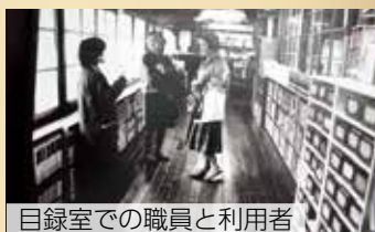
目録室での職員と利用者