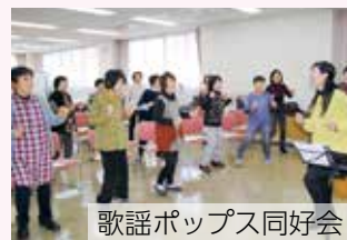
歌謡ポップス同好会

ボランティア活動やサークル活動などにも参加できます。ボランティアは、富士まつり後の清掃など年4回程度実施しています。また、「歌って、踊って、歌謡ポップス同好会」など現在6つのサークル・同好会があり、会員同士が親睦を深めたり、リフレッシュしたりする機会があります。