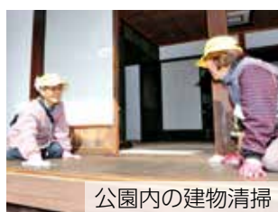
公園内の建物清掃

除草・草刈り、屋内外の清掃、包装・梱包（封入・袋詰めなど）、調理作業（皿洗い・配膳など）、換気扇の清掃、チラシ・ビラ配り、スーパーでのカート片付けなど