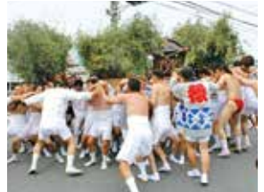
「揺する！富士市のお天王さん」より [吉原祇園祭 神輿の競り合い]