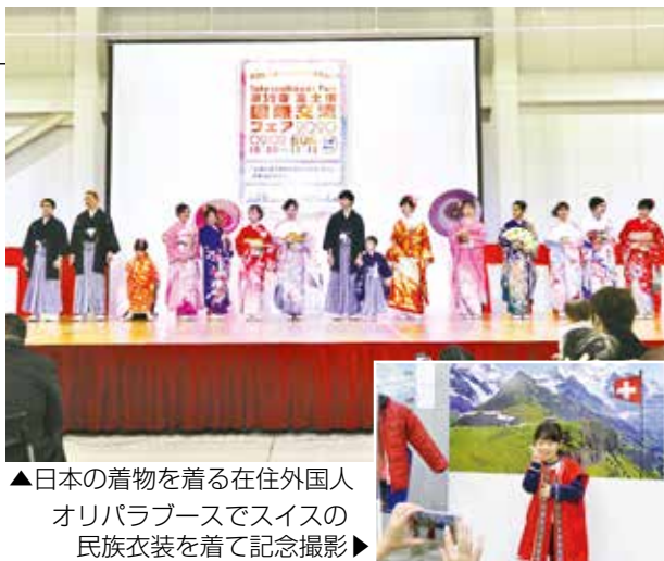
▲日本の着物を着る在住外国人オリパラブースでスイスの民族衣装を着て記念撮影

今回は東京2020オリンピック・パラリンピックの事前合宿市内で行うスイス・ラトビア・モングルを紹介するブースが設けられ、来場者は3か国についてパネルを通して学んだり、衣装を着て体感したりするなど、応援する気持ちを高めていました。