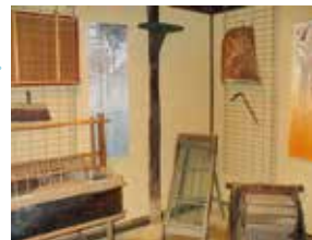
稲葉家で学ぶ 富士川の歴史と文化