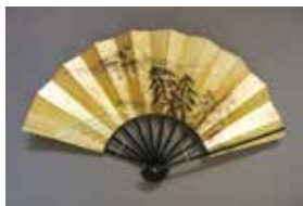
富士山コレクション展から

●展示室2 富士山の玉手箱 特集展示 「武田弘富士山コレクション展」 🕒 1月4日～5月6日 ●春のテーマ展 浮世絵版画の世界 🕒 2月1日～4月13日 休館日/ 2月3・10・12・17・25日