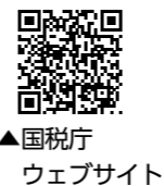
▲国税庁ウェブサイト

次に当てはまる人は、所得税の確定申告が必要です。 ・事業、不動産、譲渡などの所得があり、所得税の納付が必要になる人 ・給与を1か所から受けていて、給与以外の所得の合計が20万円を超え、かつ所得税の納付が必要になる人 など ※公的年金等の収入金額の合計額が400万円以下で、それ以外の所得金額が20万円以下の場合、所得税の確定申告は必要ありませんが、所得税が還付される場合は申告してください。 ※所得税の確定申告が不要でも、市民税・県民税の申告が必要となる場合があります。