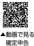
▲動画で見る確定申告

とき／2月17日(月)～3月17日(月) 9～17時(土・日曜日、祝休日を除く)