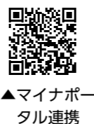
▲マイポータル連携

令和6年分の確定申告は、スマホとマイナンバーカードを利用した「ご自宅等からのe-Tax申告」をご利用ください。操作方法やマイポータルとの連携については、国税庁ウェブサイトまたは左のQRコードをご覧ください。