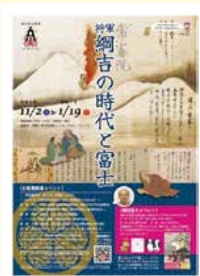
第61回企画展ポスター