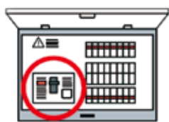
▲分電盤タイプ(内蔵型)

対象機器／(一社)日本配線システム工業会が定める感震機能付住宅用分電盤の規格に適合する構造及び機能を有する機器