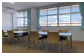
▲ミーティングルーム(2階)