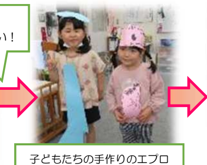
子どもたちの手作りのエプロ