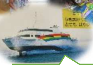
こんな船にしたいな。

ままごとキッチンの中のダイヤルを船のハンドルに見立てて遊んでいたことをきっかけに「ぼくたちで作っちゃおう」と船作りが始まりました。