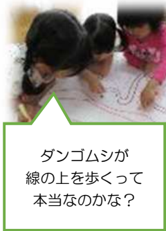
ダンゴムシが 線の上を歩いて 本当なのかな？