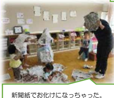
新聞紙でお化けになっちゃった。