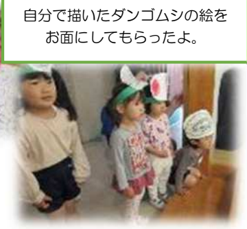
自分で描いたダンゴムシの絵を お面にしてもらったよ。