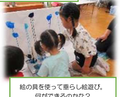
絵の具を使って垂らし絵遊び。 何ができるのかな？