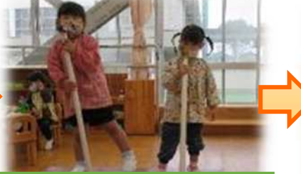
先生がスタンドマイクにしてくれたよ。 ステージでコンサートの始まり始まり。