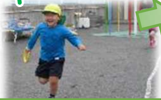
ただ走ることが楽しかった4月