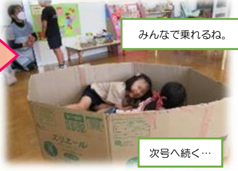
みんなで乗れるね。