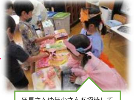
年長さんや年少さんを招待して とっても嬉しそう。