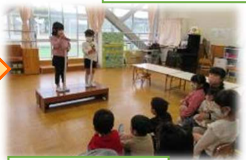
みんなが一緒だと楽しいね。