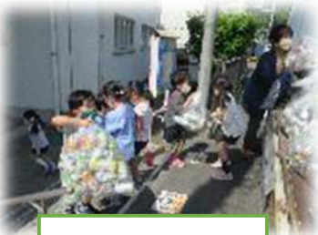
SDGsの活動 アルミ缶の積み込み