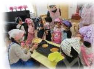
ホットケーキクッキング