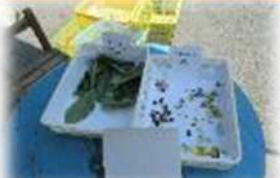
砂場で葉っぱのお茶作りを楽しんでいましたが…