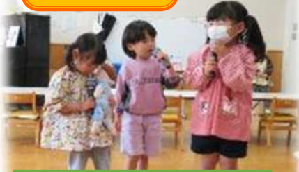
先生がマイクを作ってくれたよ。 歌を歌うの楽しいね。