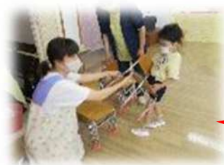
行事で使う会場の準備、片付け