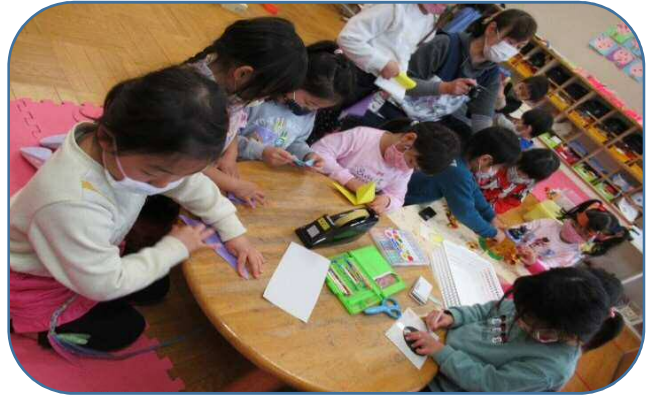
コロナ禍のため控えていた、異年齢児との交流を徐々に始めました。年少組さんに、自分たちが知っている折り紙を教えています。優しく声をかける姿が素敵です。