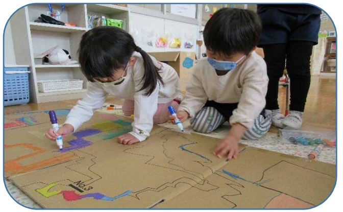
キャンプごっこや城作りなど、友達とイメージを合わせて遊ぶようになりました。必要な材料を、友達や教師と相談して決めて遊び場を作ることも楽しみました。