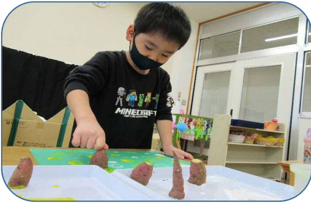
秋に収穫したさつまいもを使ってスタンプをしました。芋の繊維に気が付いたり、何度もスタンプをすると色が薄くなる様子を楽しみました。