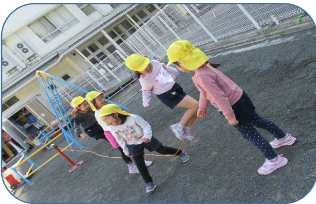
2学期から取り組んできた縄遊び。自分なりの目標をもち毎日取り組みました。長縄は、友達と気持ちを合わせることが大事。失敗しても笑い合っって何度も楽しみました。