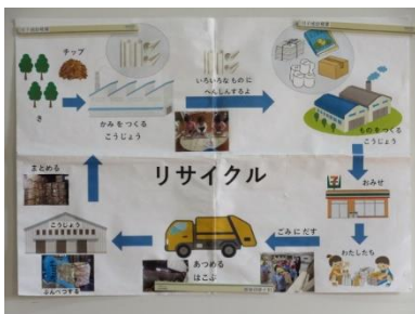
リサイクル講座の次の日