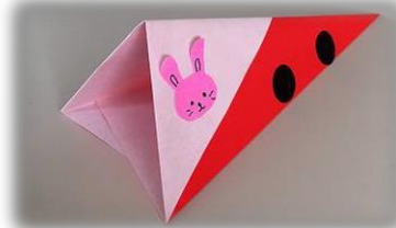
⑥完成！三角の穴を吹いて遊ぼう！タイヤをつけたり、運転手を描いたりしても楽しいですね。