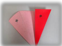
⑤☆の部分を重ねてのりで止める。