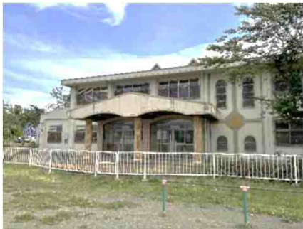
(改修前の現況写真)

多くの皆様にとって覚えやすく、親しみやすい施設となるよう、本施設の愛称を募集します。