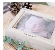
メモリアルボックス