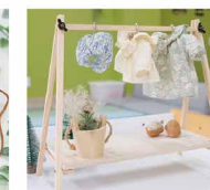
ドアハンガーラック