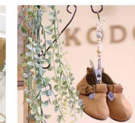
シューズクリップ