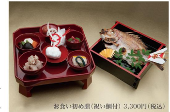
お祝い初め膳(祝い鯛付) 3,300円(税込)