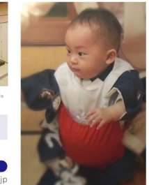
初誕生祝いには紅白の一升袋で演出。 お写真映える紅白袋をお貸しします。

お子様の各種お祝いに対応できるよう、ペーパーベットのレンタル、お子様用椅子などのご用意がございます。 ※個室のご利用はご利用金額に10%のサービス料を頂戴しております。