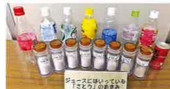
例：ジュースの砂糖の量モデル

健診日に合わせて インボディ測定をお願い しました。 ここ数年実施しているので、 結果を比較できて、改善した 人もいました。