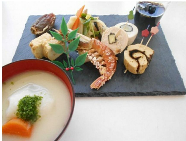
講座で作ったお正月料理