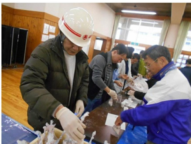
バッククッキングの準備をする様子