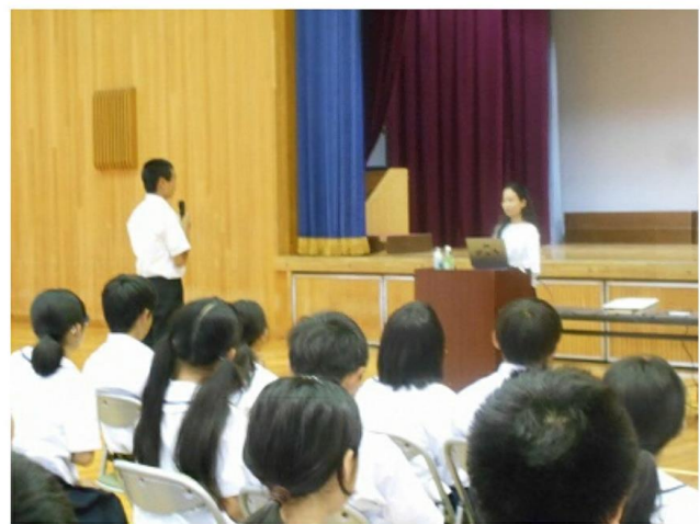
講師の先生に感想を伝える生徒