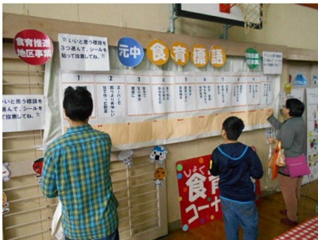
食育標語の投票の様子