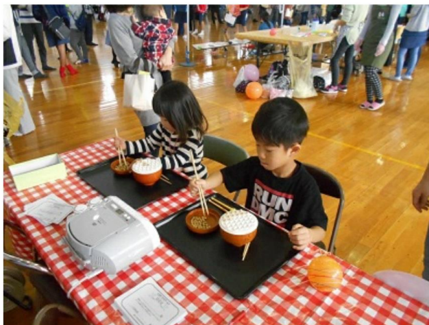
豆つかみゲームでおはしの練習