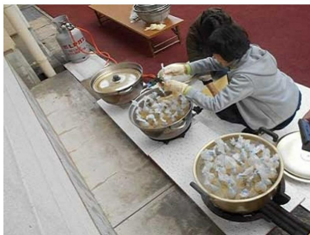
鍋で袋を茹でる様子