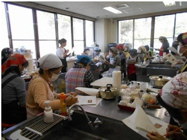
お正月料理講座の様子