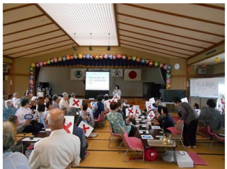
敬老会における食育クイズ