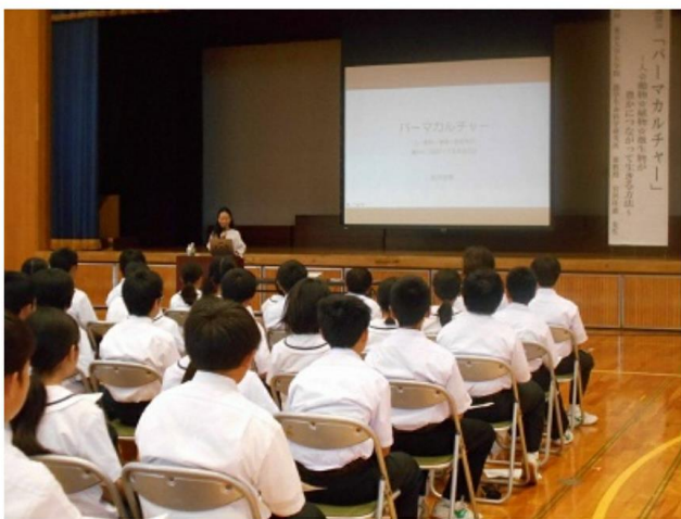
食育講演会の様子