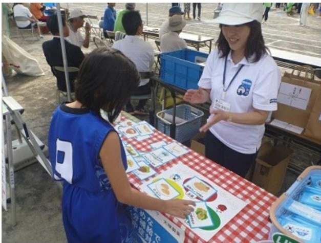
食育ブースの様子