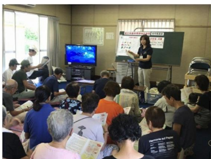
非常時の食生活や食料備蓄のお話の様子