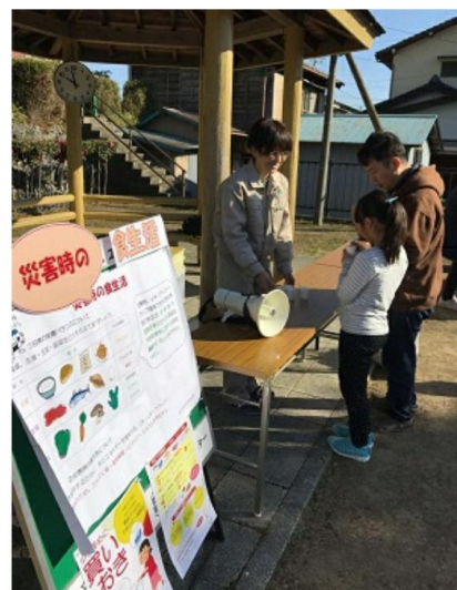
非常用保存食の試食の様子