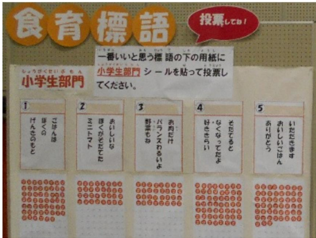
食育標語（小学生部門）の投票