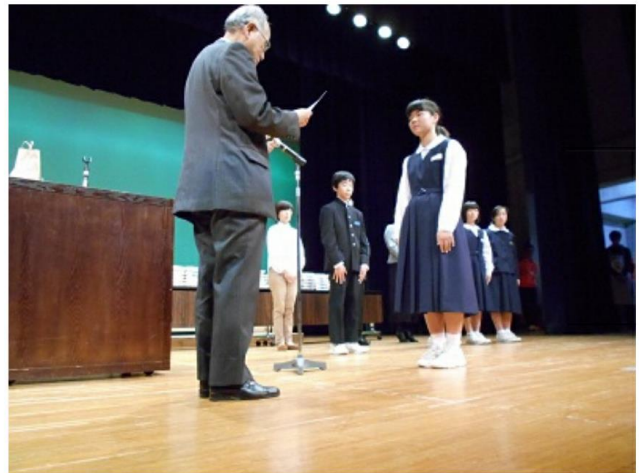
食育標語表彰式の様子