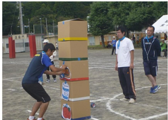
食事バランスゲームの様子