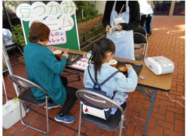
豆つかみゲームでおはしの練習