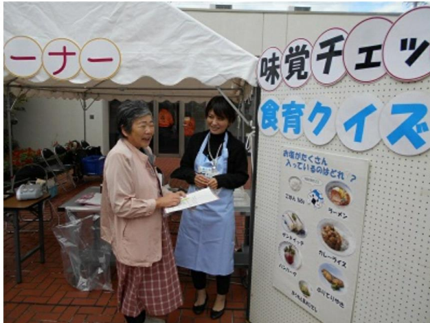
食育クイズの様子