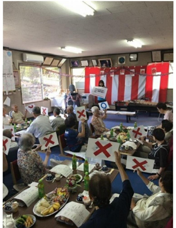
敬老会における食育クイズ