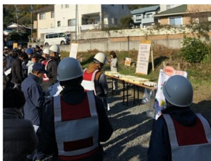
非常時の食生活や食料備蓄のお話の様子2