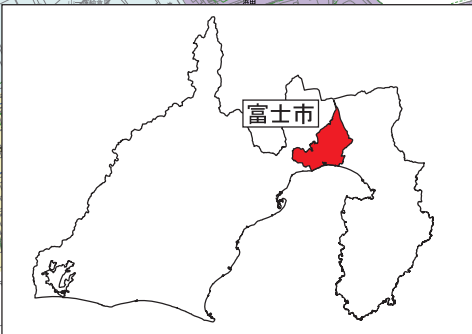
変更対象用途地域