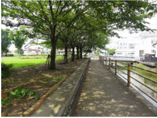
田宿川沿いの遊歩道と公園