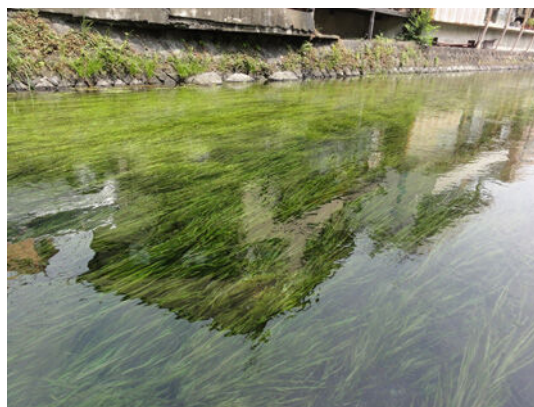
清流に揺れるナガエミクリ