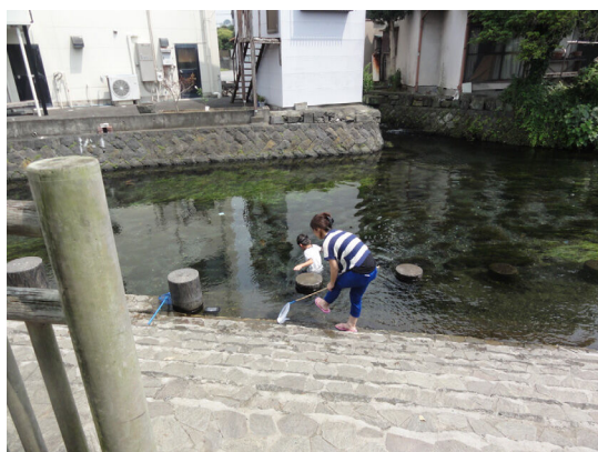
親水護岸で水遊びをする親子