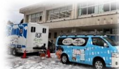
トイレトレーラー出動