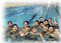
スイス選手との交流