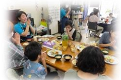
「三世代食堂」の学生交流