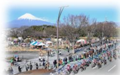
サイクルロードレース開催