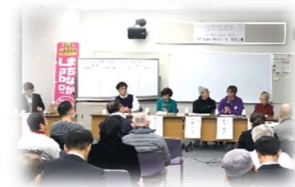
報告・意見交換会の様子