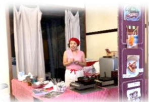
テストマーケティングの様子(R1)