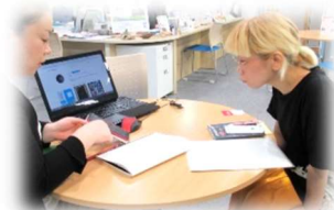
起業・出店相談の様子

また、事業者受付開始日にはキックオフイベント(本企画)、相談支援終了日には報告・意見交換会も実施し、不動産オーナーや商店街関係者の方々も巻き込んだ、中心市街地の遊休不動産利活用促進を行う事業です。