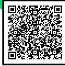
参加者案内(中止発表)