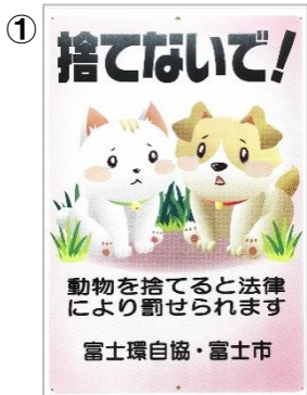
「動物を捨てないで」