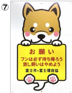
「フンは持ち帰ろう」大