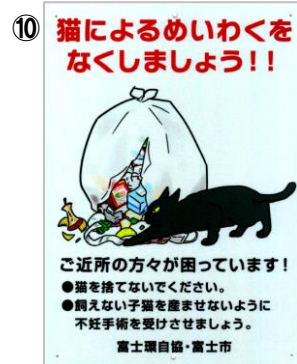
「猫のめいわくをなくしましょう」