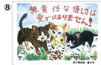
「猫へのえさやりについて」