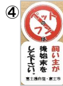
「犬のフン放置警告」