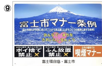
「富士市マナー条例」