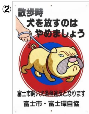
「犬をはなさないように」