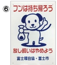
「フンは持ち帰ろう」中