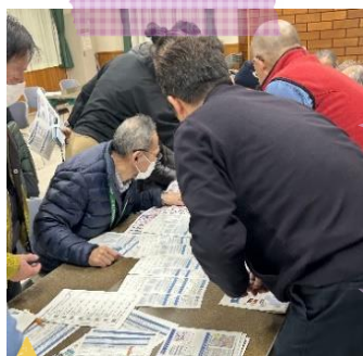
訪問準備のようす

要支援者が避難するためには、「だれと」「どこに」「どうやって」を事前に 確認しておく必要があります。 避難のタイミングとヒアリング担当者を 決めたあと、聞き取りのためのシミュ レーションを行いました。