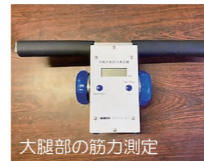
大腿部の筋力測定 内転外転筋力測定器