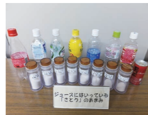
ジュースの砂糖の量モデル