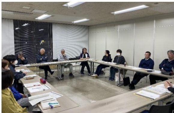
R8.3.16 バレーボール協会

令和8年3月には、バレーボール協会や陸上競技団体の方々、4月はバスケットボール協会やソフトボール協会の方々との今後の方向性等についてヒアリングを実施しました。ヒアリングでは、現在の富士市の部活動地域展開の状況に関する情報共有や、各種目で状況が異なる中でどのように進めていくことができるのか、団体の方々から様々な意見やアイデアを出していただきました。