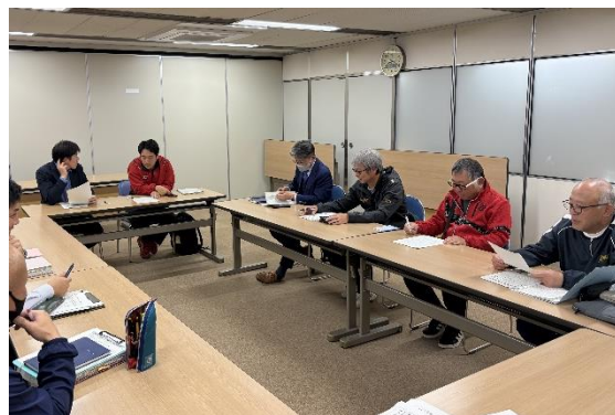
R8.4.30 ソフトボール協会