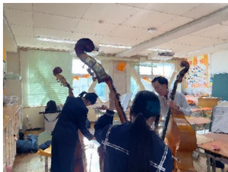
吹奏楽(楽器別練習会)①