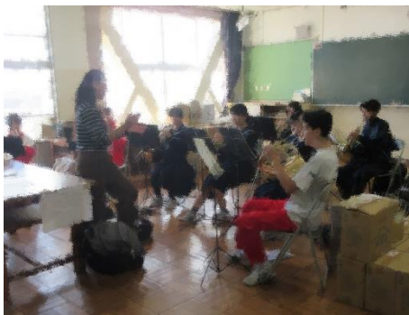
吹奏楽(楽器別練習会)②