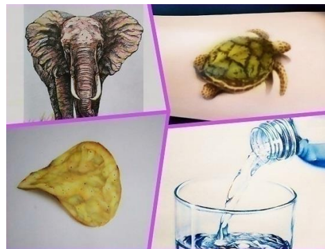
色鉛筆アートイメージ