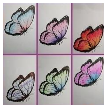
当日の課題イメージ