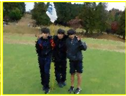
リバー富士 カントリークラブ