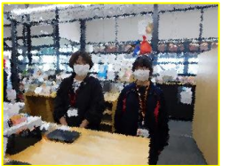
インク富士 本市場町店