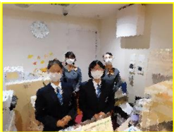
富士川SAコンシ ェルジュカウター