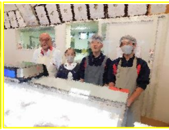
グロースヴァルト SANO