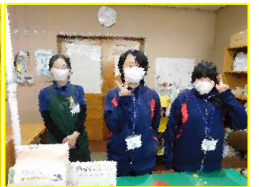
中央図書館富士川 分室