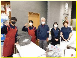
お土産処サンロク