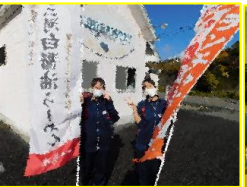
一番亭富士松野店