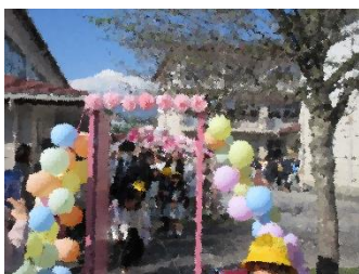
多くの地域の方が入学を祝っていただきました