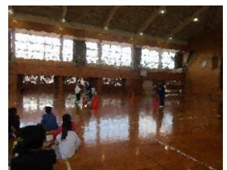
4年生 交通安全教室 （自転車の乗り方）