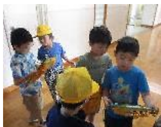
1年生・2年生 生活科 「学校探検」